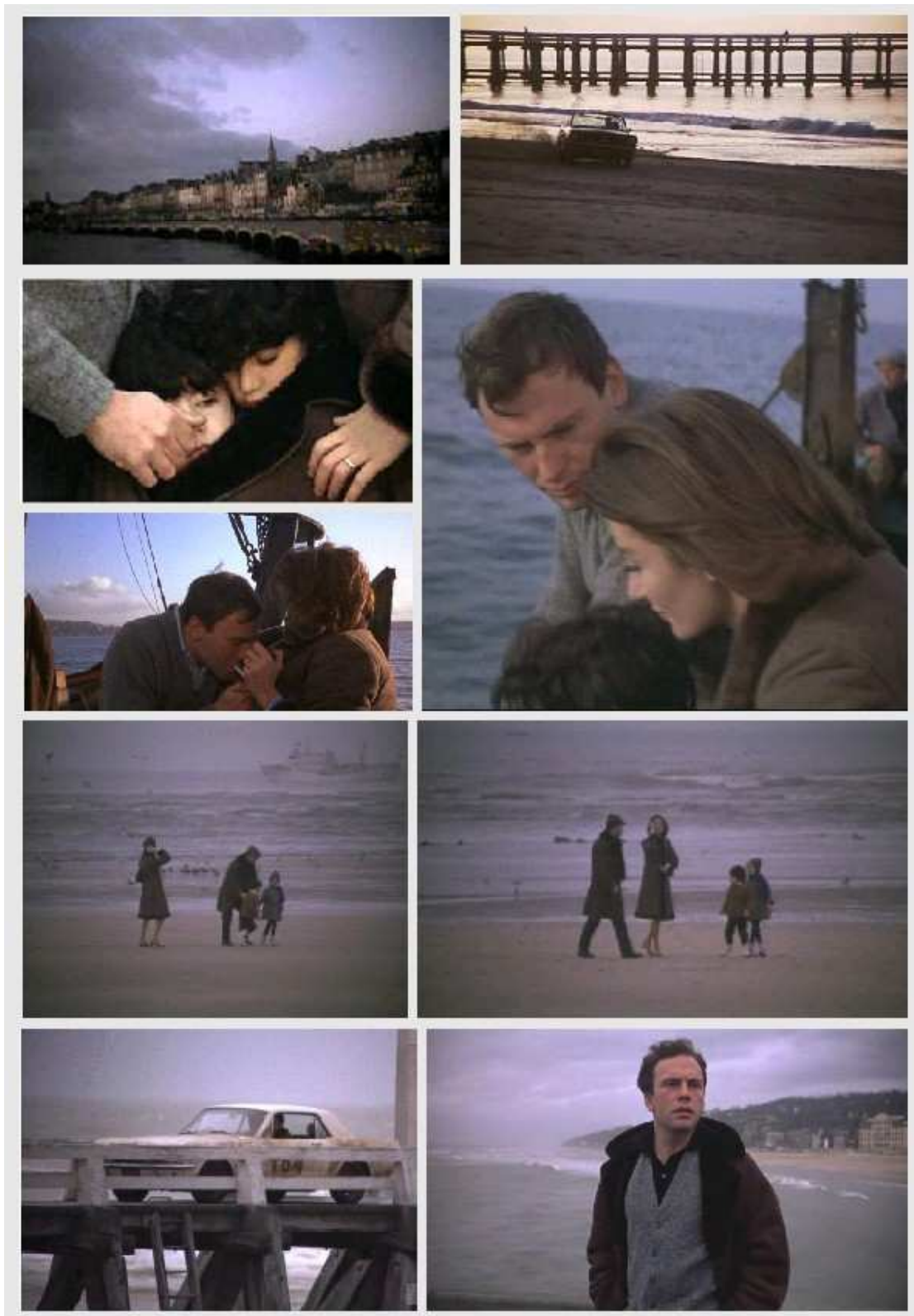
Довиль и его море в фильме.

Довиль в фильме немного отстранен. Его образ создает не только шум моря, но и звук корабля в глубине кадра, этот низкий могучий сигнал, перекрывающий стихию. И крики чаек. А контрастом к этой мощи стихии – наиболее хрупкое – дети. Их смех, игры, суета и свобода.