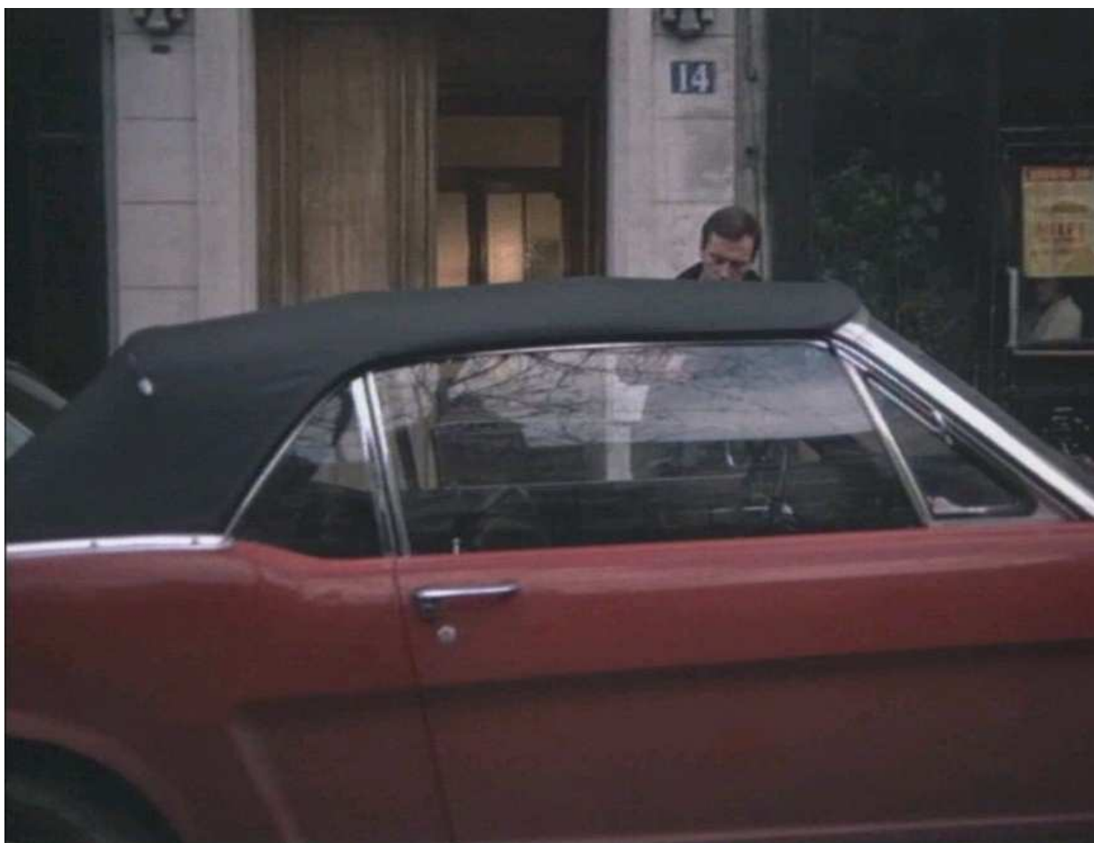
Утро в воскресенье.

Шумов в фильме на самом деле мало, но все они очень важны и очень точны. Вот воскресная тишина утра: чирикание (а не пение) птиц и далекий лай собак во дворе.