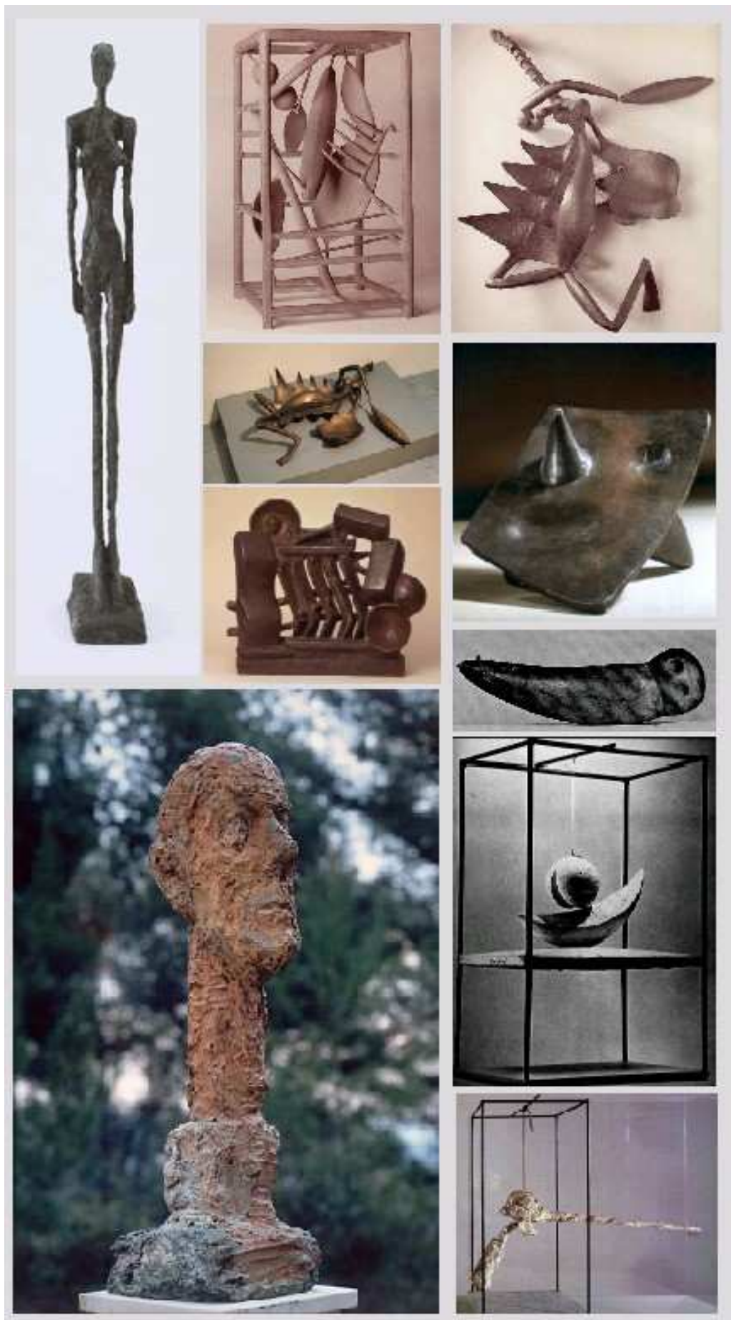
Скульптор Альберто Джакометти.