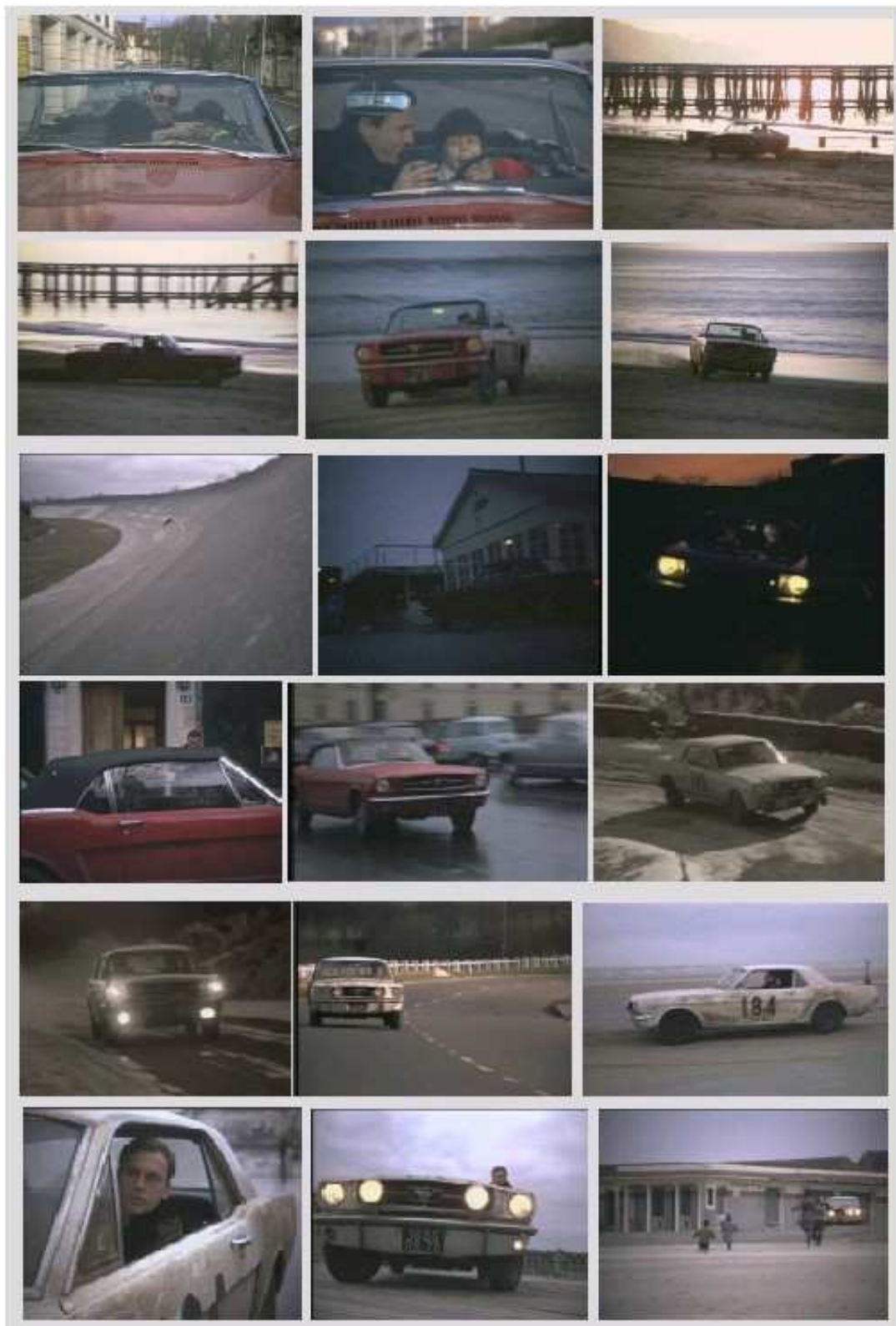
Форд «Мустанг» как третий главный герой фильма К. Лелюша.

Еще один лейтмотив фильма – звук двигателя. Начиная от зажигания и во многих вариантах. О нем, кстати, упоминает герой в своем рассказе в ресторане – это очень важный для него звук: «его чувствуешь всем телом». Вот такая сложная вербально-невербальная переключка.