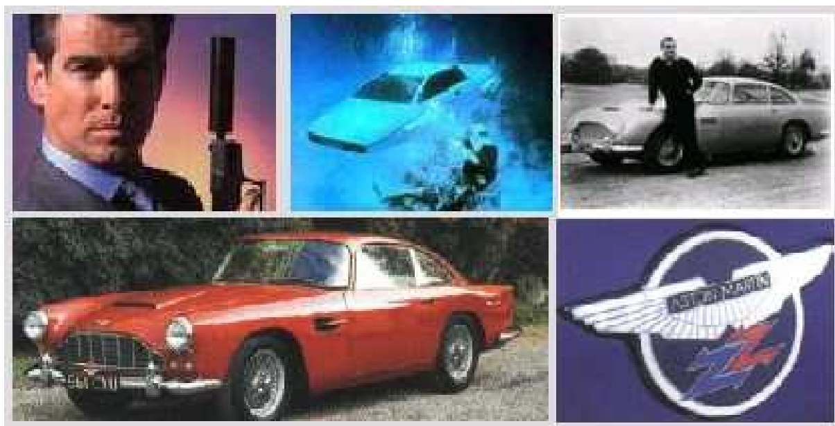
Бонд и его автомобили как элементы бренда.

Не удивительно, что на одном из последних аукционов в Лондоне был продан за 105 тысяч фунтов стерлингов именной автомобиль-амфибия Бонда Lotus Esprit, символ артистического дизайна своего времени.