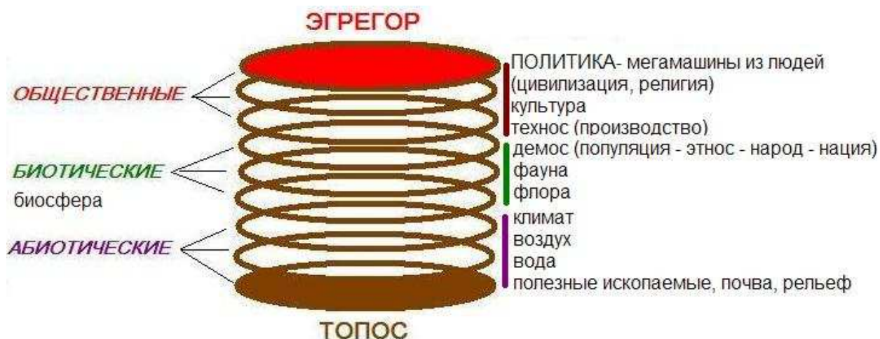
Рис. 2. Совокупность основных геополитических факторов.

Что характерно, гипотезы о влиянии нижней части этого построения (гео) на верхнюю (политика) присутствуют во всей истории. Вот как эти особенности трактовались, начиная с древнейших времен. Но здесь пока мы имеем дело с набором фрагментарных знаний и мнений о влиянии географических условий на жизнь человеческих сообществ.