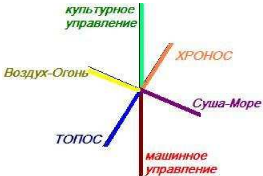
Рис. 5. Объемная модель геополитики в нашем понимании.

Соединить их можно как вместе в объемной модели, так и попарно.