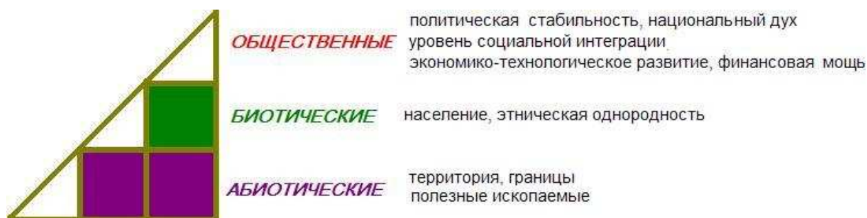
Рис. 3. Критерии Н. Спикмена по отношению к тройке ресурсов.

Такая модель, идущая еще от Ф. Ратцеля, получила в истории геополитики очень подробное развитие: каждый из выделенных здесь видов был детализирован на множество уровней и подуровней. Например, Николас Спикмен выдвинул десять критериев геополитического веса: