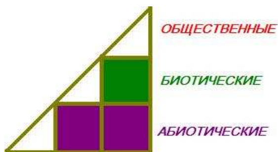
Рис. 2. Три вида ресурсов.

Модель ресурсов, которыми может располагать геополитик, может быть построена по простому основанию. Изобразим ее на схеме: