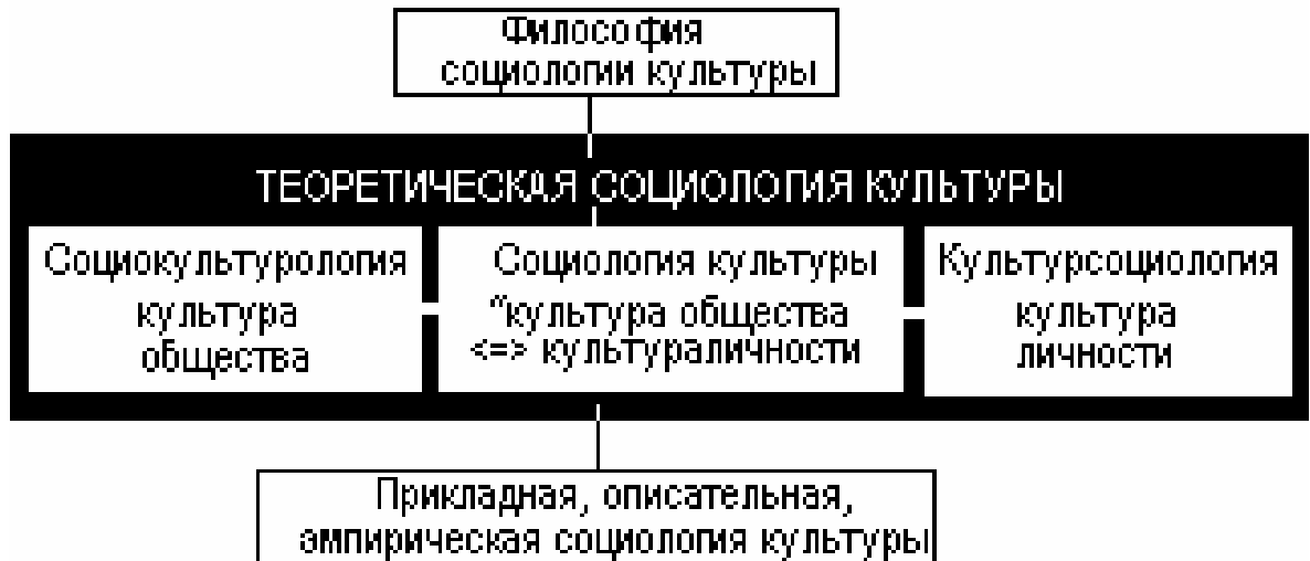
Рис. 1. Иерархическое устройство социологии и культурологии.

Как уже было отмечено, “социология культуры” имеет две равноправные составляющие: социологию и культурологию. Рядоположенные, они могут рассматриваться принципиально в своем научно-иерархическом контексте: